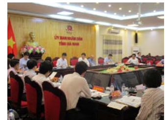
ハナム省人民委員会で副委員長から日系企業の進出について説明を受ける様子（平成30年度）

※ 研修の日程等は、都合により変更される場合があります。あらかじめご了承ください。