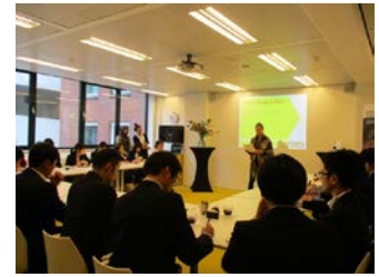
アムステルダム市にある女性センターAtriaでオランダの働き方について説明を受ける様子（平成30年度）