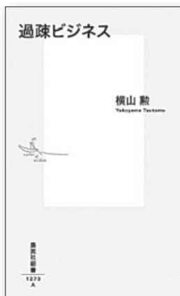
『過疎ビジネス』 横山勲／著 集英社

ある。『過疎ビジネス』（横山勲／著、集英社、1,100円、2025年7月刊行）は、河北新報の記者である筆者による、福島県国見町で実際に起きた地方創生事業を巡る疑惑を徹底的に追った調査報道に基づく書籍である。人口約8,000人の国見町で、企業版ふるさと納税を原資に12台もの高規格救急車を購入し他の自治体にリースするという計画が、実際には事業を提案したコンサル企業が寄付をした企業に対して資金還流を行うための隠れ蓑になっていたという疑惑である。ただ読み進める中で最も衝撃的なのは、事業を主導した企業の社長が過疎自治体を見下す発言をしていた録音データの内容であろう。過疎地に救いの手を差し伸べるようでありながら、実際は専門知識のない役場職員や議員を馬鹿にしつつ公金を吸い上げるという、まさに本書のタイトルが象徴する冷酷なリアリティがそこから見える。悪用されてしまった制度的な問題に加え、人口減少とともに役場そのものも限界に立たされ、そして地方創生政策をその限界役場が担っていることのそれぞれを、直視すべき現実として受け止めるべきである。