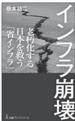
『インフラ崩壊—老朽化する日本を救う「省インフラ」』 根本祐二／著 株式会社日経BP・日本経済新聞出版

人口減少と少子高齢化、東京一極集中という日本の構造的課題に対処するために2014年から始まった地方創生政策は、近年における岸田内閣の「デジタル田園都市国家構想」、石破内閣の「新しい地方経済・生活環境創生」、そして高市内閣での「地域未来戦略」と看板を掛け替えながらも一貫して継続している。地方創生政策は、個々の地方公共団体が人口見通しと戦略のもと人口維持や経済活性化のための取り組みを進め、国はそれを財政や人材、情報という面から支援するものである。しかし一方で地方公共団体の現場では、仕事量の増加と人員不足から地に足のついた政策立案が出来ない現実があることもまた事実で